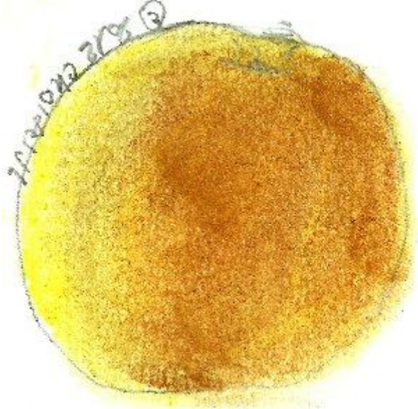
pastel choisel jean-louis 2012